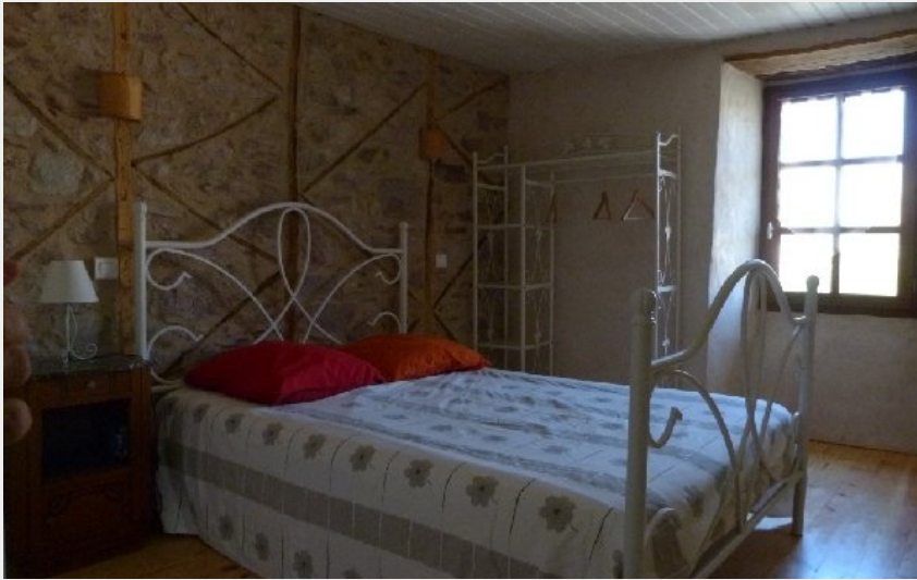
Crédit photo : Gîte des Puech - Chambre (SYNDICAT D'INITIATIVE DES RASPES DU TARN)