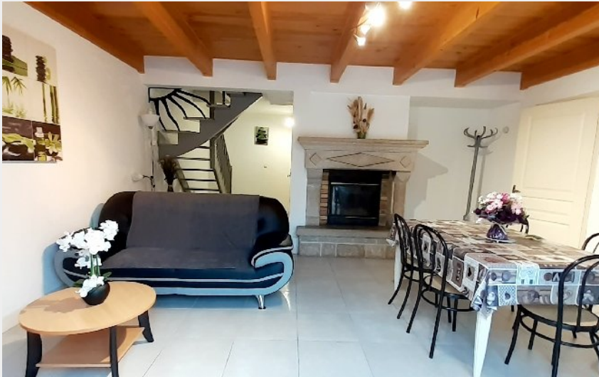
Crédit photo : Gîtes des rochers - Aux Acacias - AYGG57 (Gîtes des rochers )