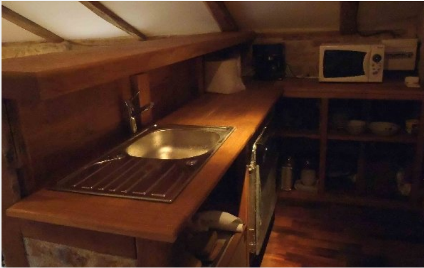
La Grange de Courry