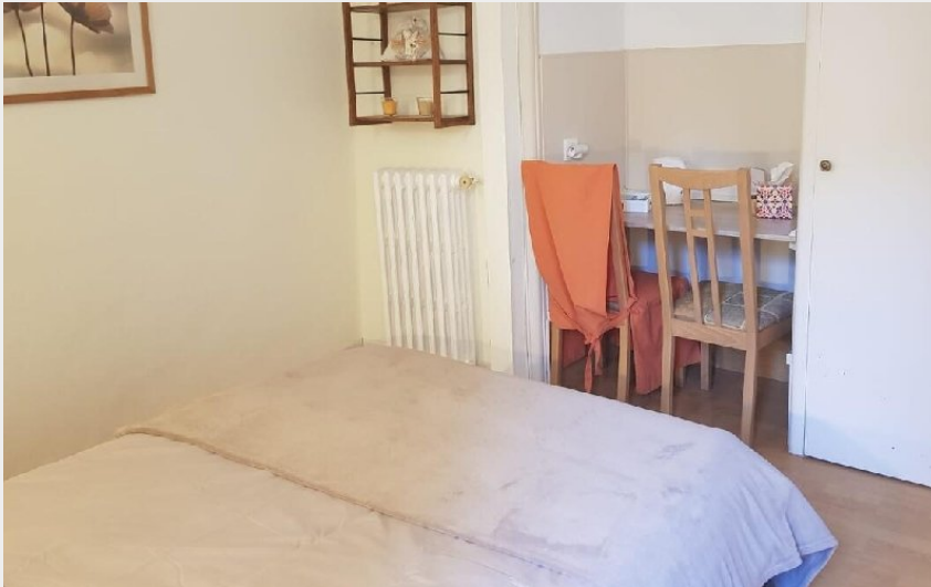
La pierre pointue