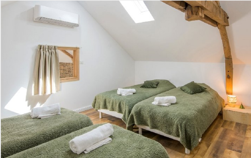
Crédit photo : La Porcherie (OFFICE DE TOURISME DE PARELOUP LEVEZOU)