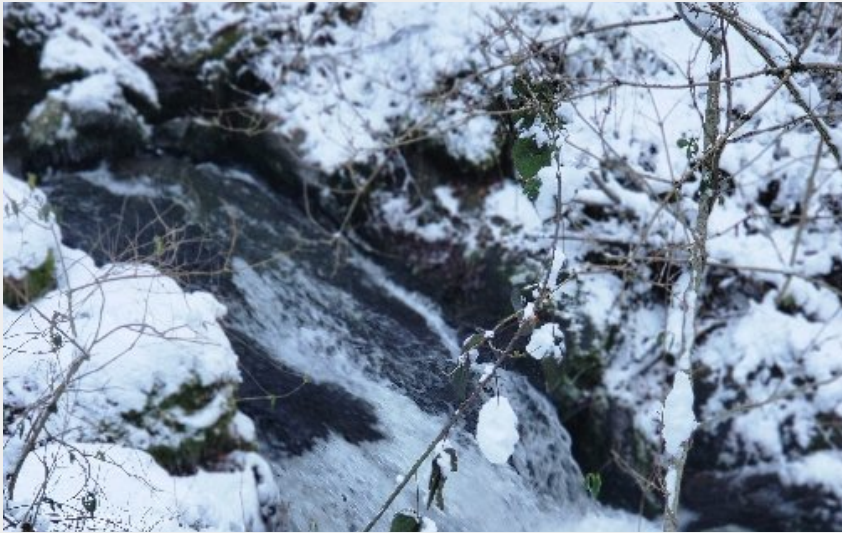
Crédit photo : La tanière de Claire en hiver (OFFICE DE TOURISME DE PARELOUP LEVEZOU)