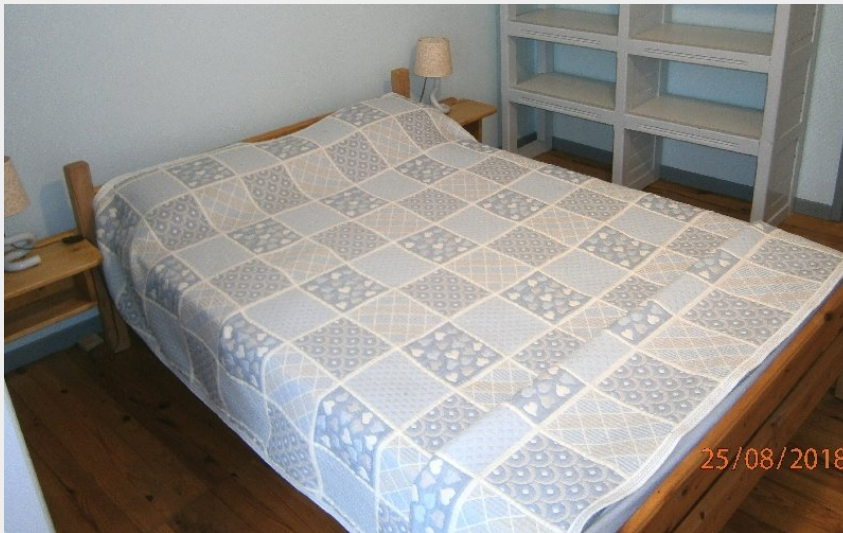
Crédit photo : Gîte Le Cigalon chambre 2 lit 140 à l'étage (Le Cigalon)