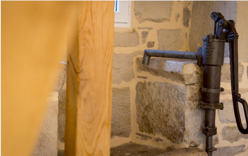
Crédit photo : Le Crochet de Pervenche -18©F-RAYNAL-Causses-Aubrac.jpeg