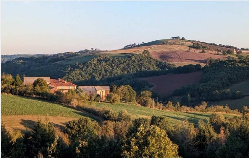
Crédit photo : Environnement naturel Le Logis Fleuri (Le Logis Fleuri)