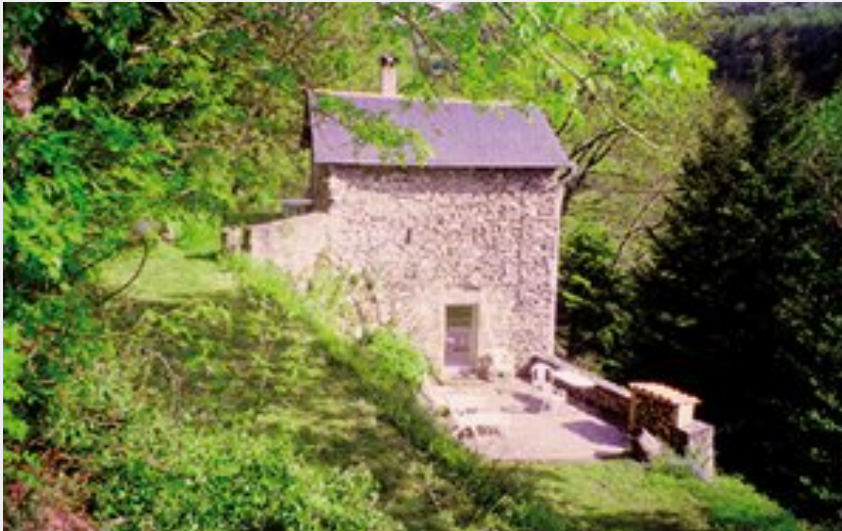
Crédit photo : Le Moulin (Comité Départemental du Tourisme de l'Aveyron)