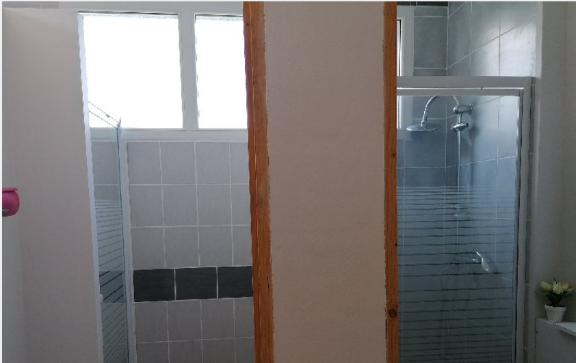
Le refuge de Lenne