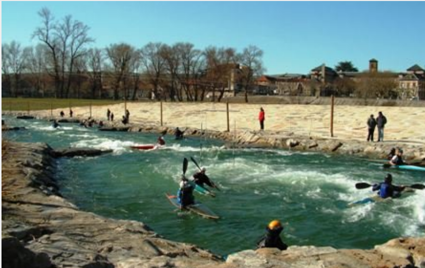
Crédit photo : Les Chalets de Millau sur les Berges du Tarn (Les Chalets de Millau sur les Berges du Tarn)