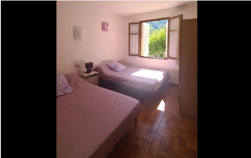
Crédit photo : Les Gîtes d'Yvette - Le 815 (Les Gîtes d'Yvette - Bungalow)