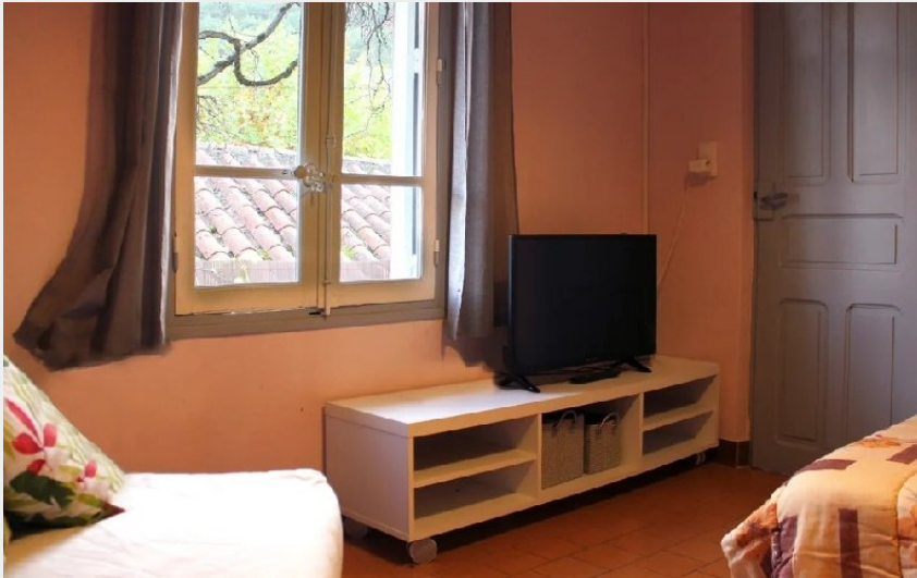
Crédit photo : Les Gîtes d'Yvette - Le Capluc (Les Gîtes d'Yvette - Bungalow)