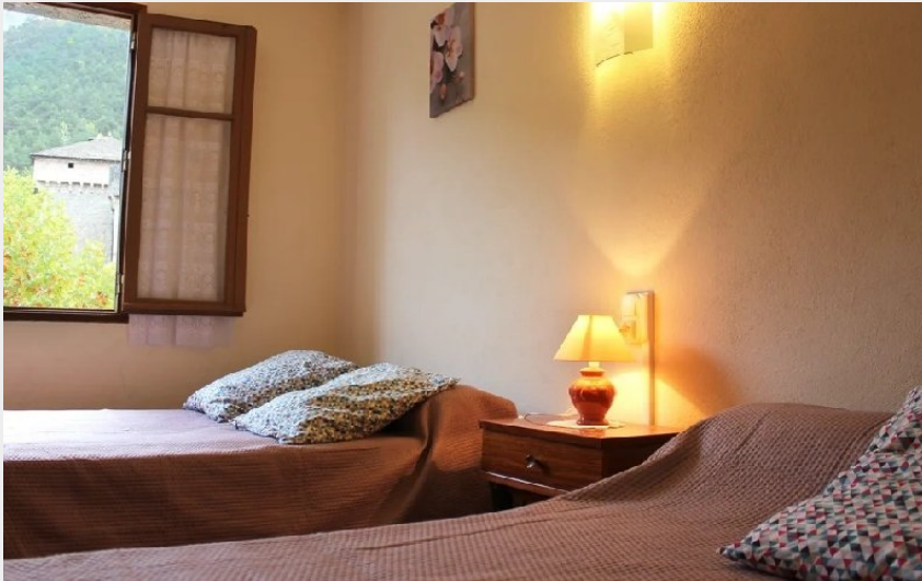
Crédit photo : Les Gîtes d'Yvette - Le Montaigu (Les Gîtes d'Yvette - Bungalow)