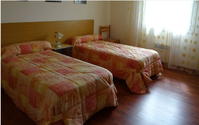
Crédit photo : Mas Capel - Le Bois de Chêne (OFFICE DE TOURISME DE PARELOUP LEVEZOU)