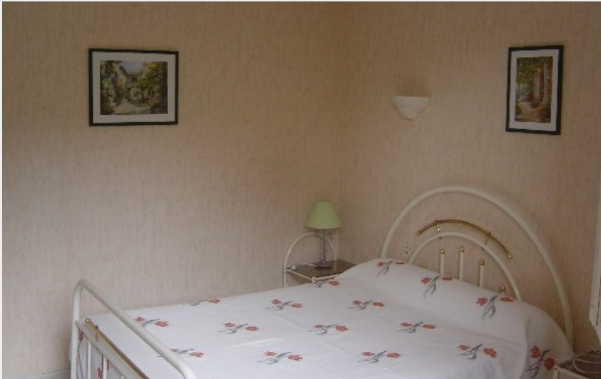
Crédit photo : Andrée VILLENEUVE - GITE 1 (OFFICE DE TOURISME DU PAYS SAINT-SERNINOIS)