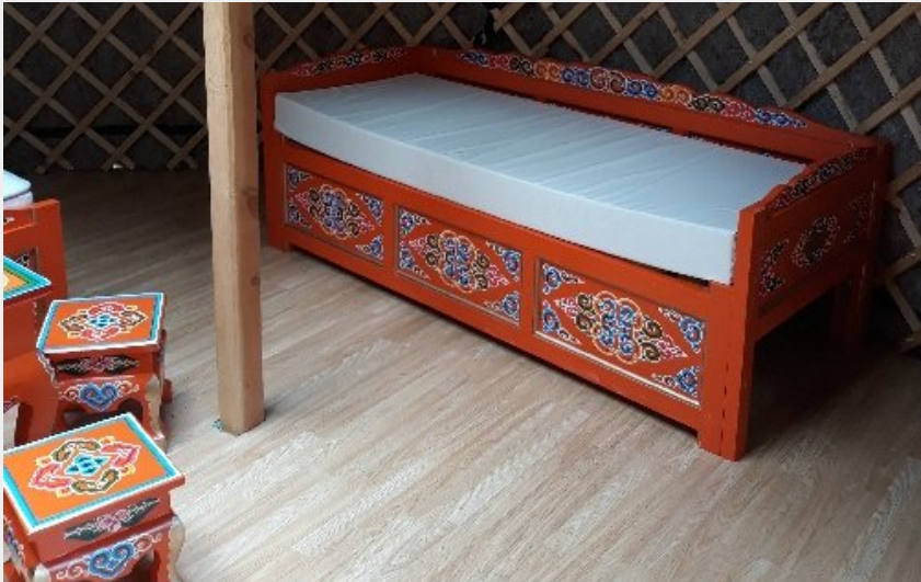
Crédit photo : Intérieur de la yourte (Camping Le Plô Recoules-Prévinquières)