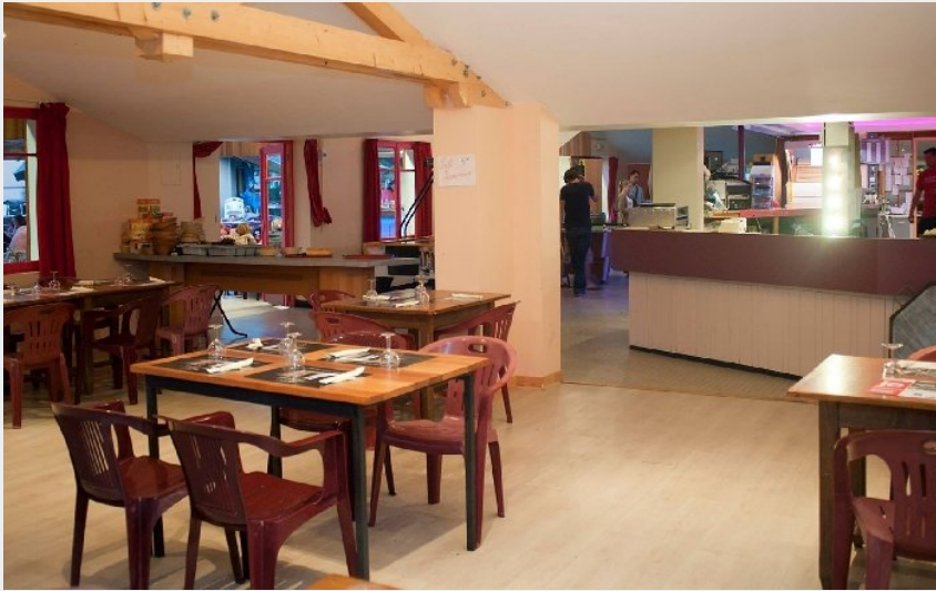
"L'Oustal de Jeanne" - restaurant