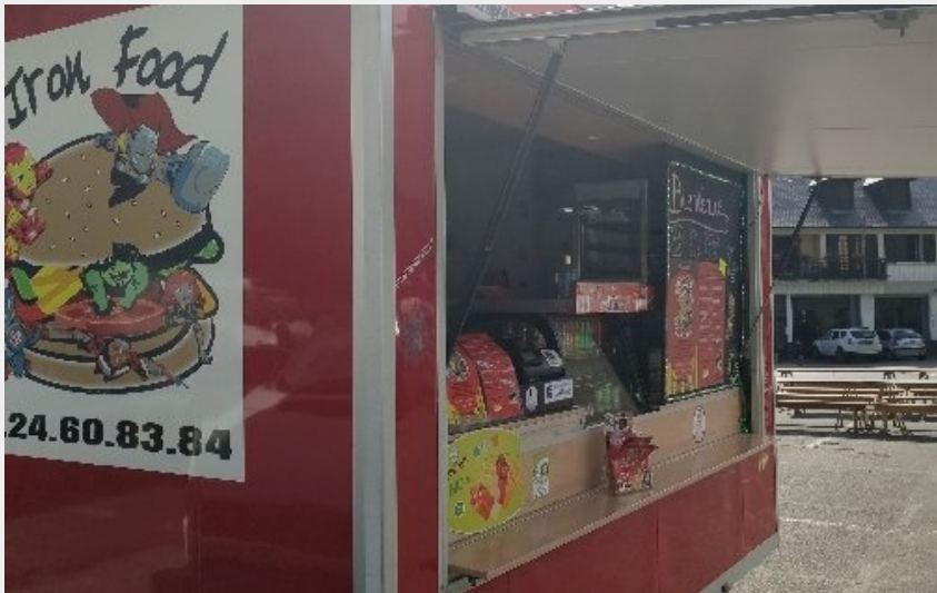
Crédit photo : L'Iron Food (OFFICE DE TOURISME DE PARELOUP LEVEZOU)