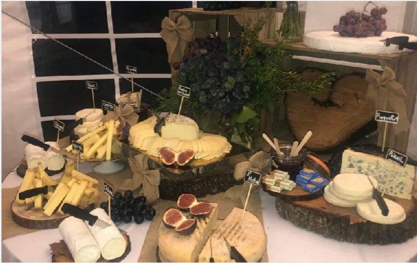
Crédit photo : Buffet de fromages locaux (La Grange Templière 2018)