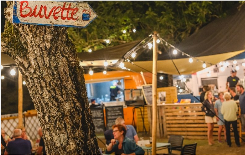
La guinguette du Bénéfire