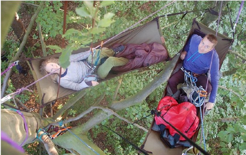
Crédit photo : A la croisée des Arbres : Grimpe d'arbres (A la croisée des arbres)