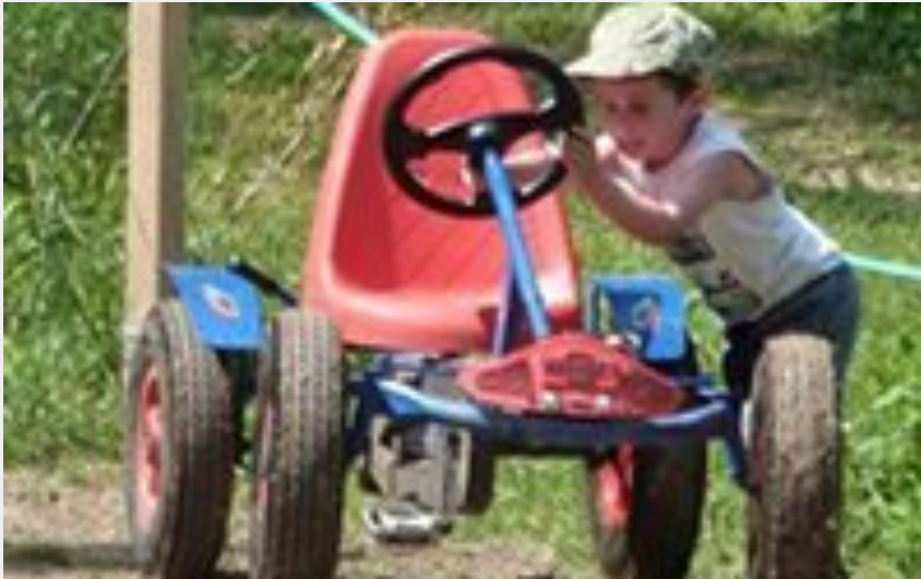
Crédit photo : Acroparc du Mas - Jeux pour enfants (Acroparc du Mas)