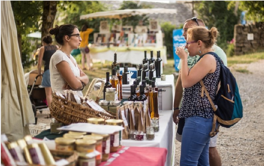
Aromatiques du Larzac