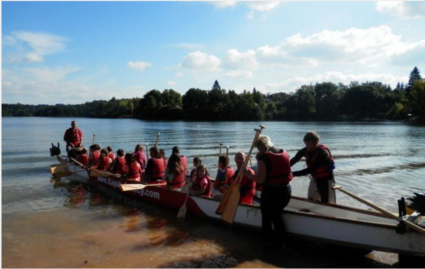
Crédit photo : Base nautique l'Anse du Lac (OFFICE DE TOURISME DE PARELOUP LEVEZOU)