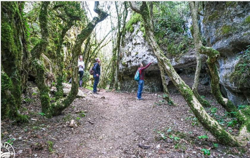
Les Canoles ou failles de Canalettes