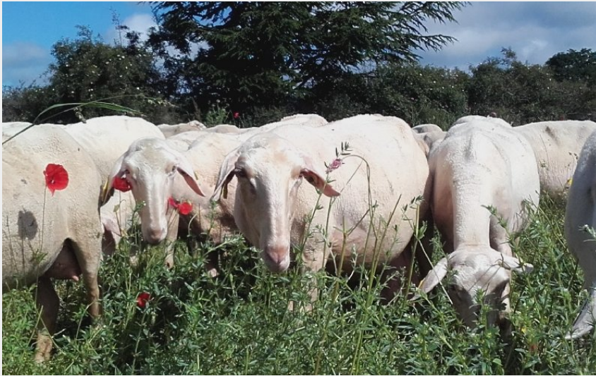
(Randonnée à dromadaires - Ferme de la Blaquière (groupes))