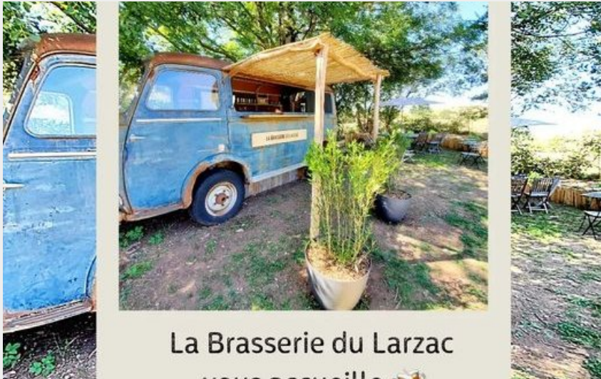
La Brasserie du Larzac