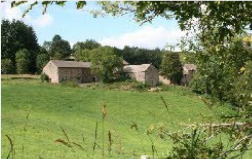
La ferme de Lacan