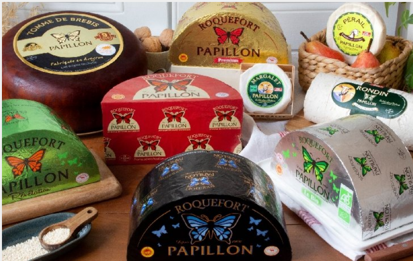
Crédit photo : Les Caves Papillon (OFFICE DE TOURISME PAYS DU ROQUEFORT )