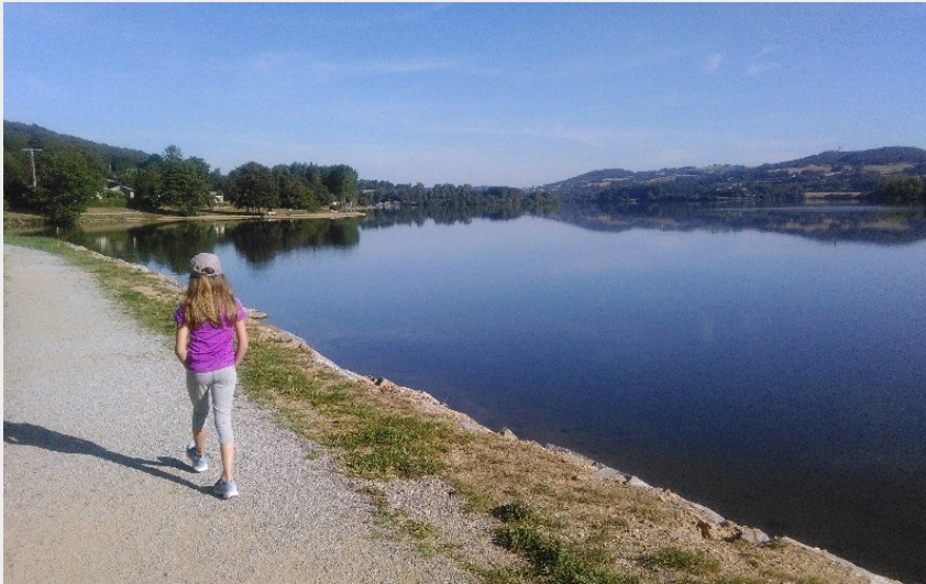
Sentier du tour du lac