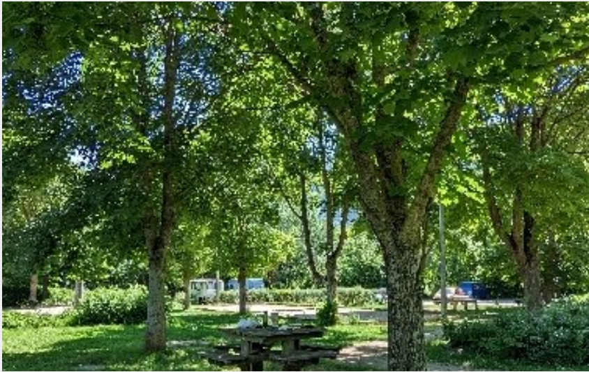
Crédit photo : Aire de pique-nique d'Aguessac (©P.Printz OT Millau)