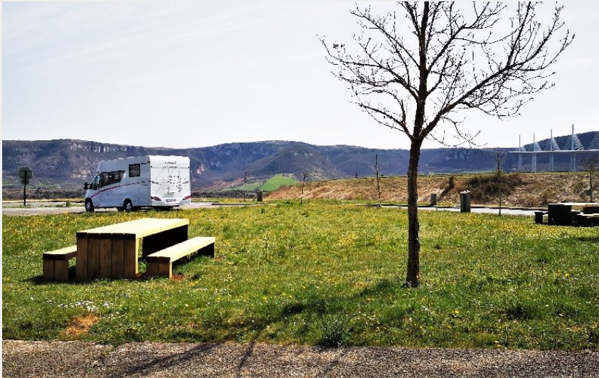
Crédit photo : Aire de pique-nique de Brocuéjous (OFFICE DE TOURISME DE MILLAU)