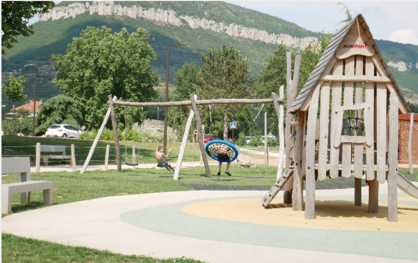
Aire de pique-nique de Gourg de Bades