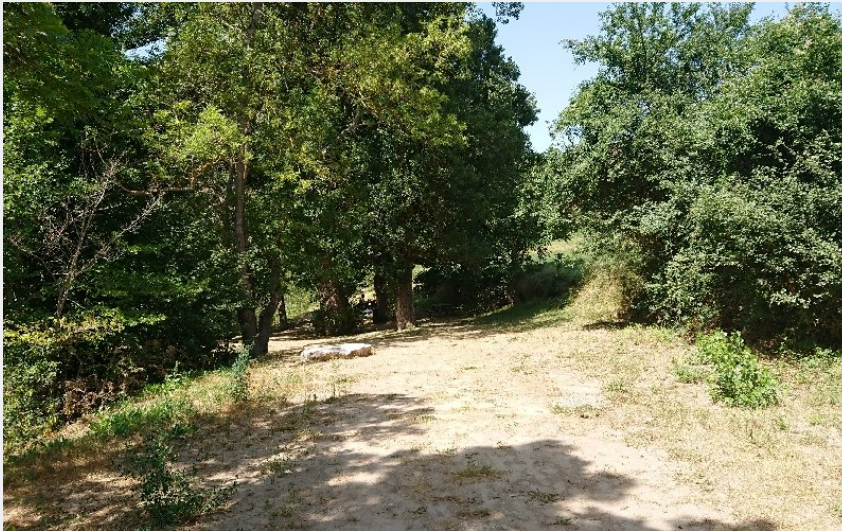
Aire de pique-nique de Mostuéjols