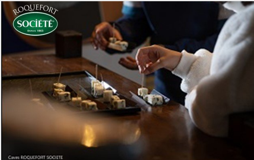
Crédit photo : Dégustation visite des caves Roquefort Société (Restaurant Les Fleurines)