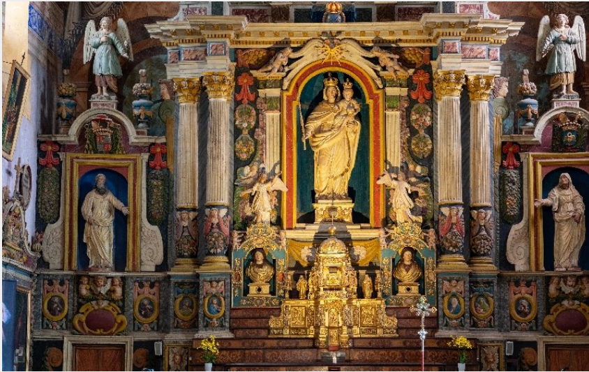
Crédit photo : Le retable (photo : Mr Georges Blanès) (Photo : Mr Georges Blanès)