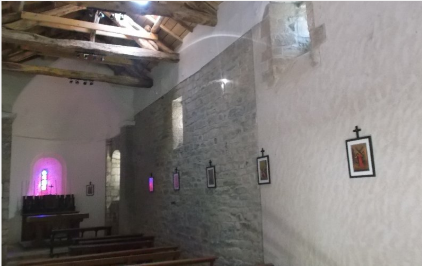
Crédit photo : Chapelle St-Amans de Valsorgue (Chapelle St-Amans de Valsorgue)