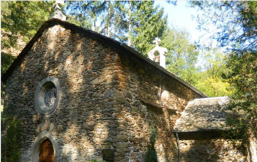
Chapelle St-Cyrice et Sentier d'interprétation