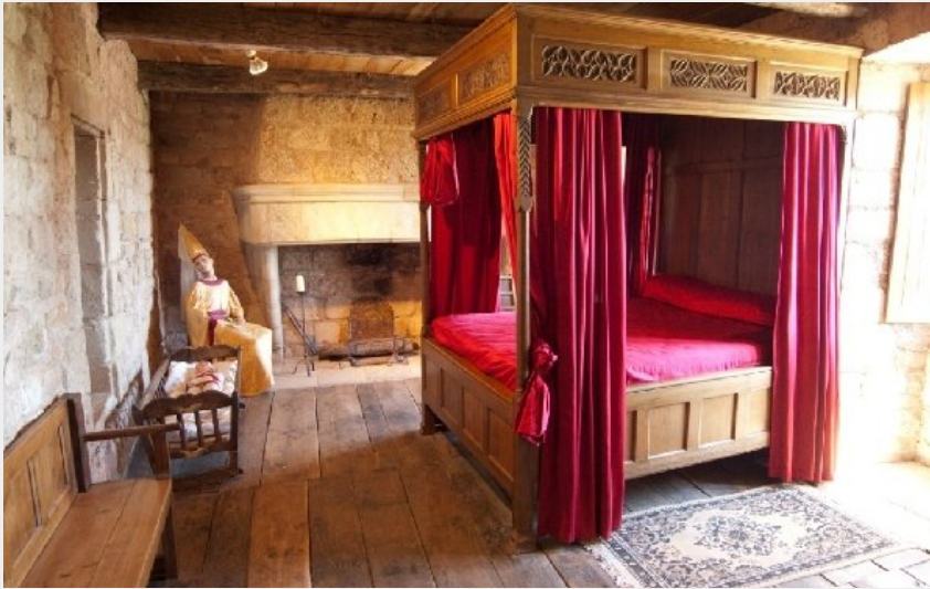
Chambre de la princesse