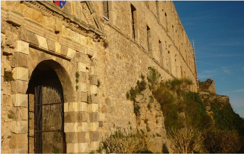
Château de Sévérac