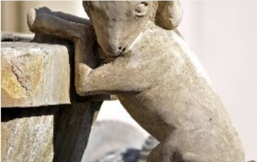
Visite de ville de Saint-Affrique