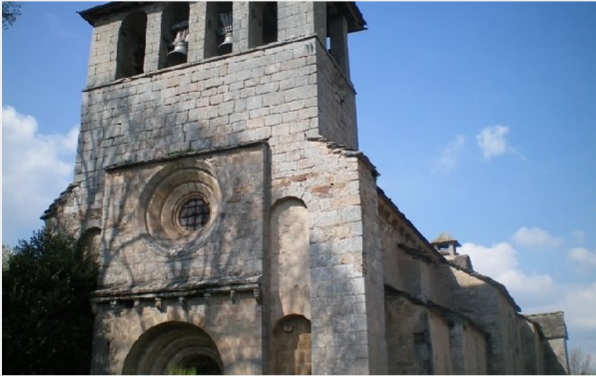
Eglise de Saint-Agnan