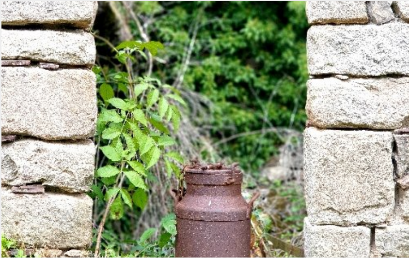
Hameau médiéval de Saint-Caprazy