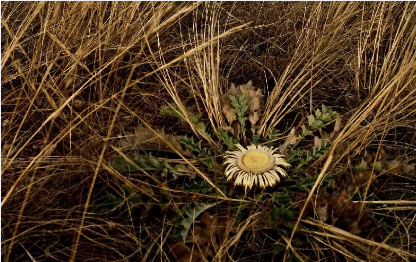
Cardabelle, chardon emblématique du Larzac