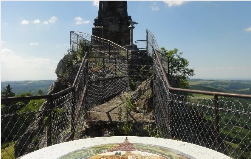
Point de vue et table d'orientation