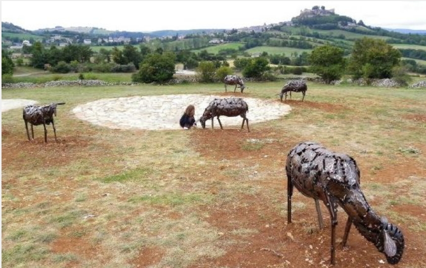
Crédit photo : Le Sentier du Berger (OFFICE DE TOURISME DE SEVERAC LE CHATEAU)