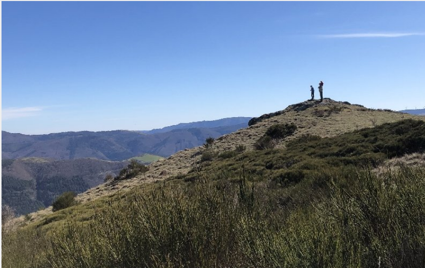
Crédit photo : Sommet du Merdelou (Office de Tourisme Rougier d'Aveyron Sud)