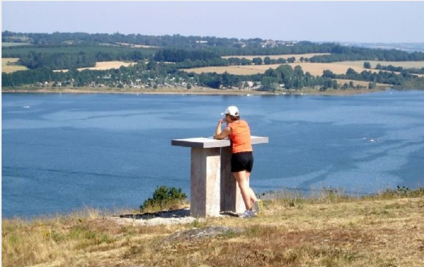
Notre Dame des Lacs